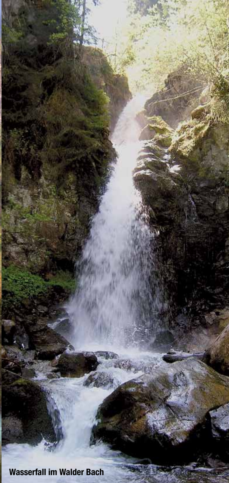
Wasserfall im Walder Bach